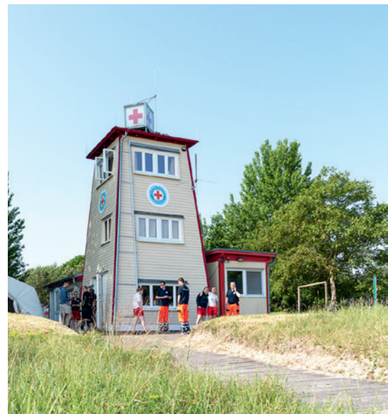
Der historische Holzturm der Wasserwacht ist ein inoffizielles Wahrzeichen der Halbinsel Priwall.

Wasserwacht in Schleswig-Holstein. Die Strandwache und die Absicherung von Veranstaltungen ist übrigens nicht die einzige Aufgabe: Training und Ausbildung von Rettungsschwimmer:innen finden ganzjährig statt.