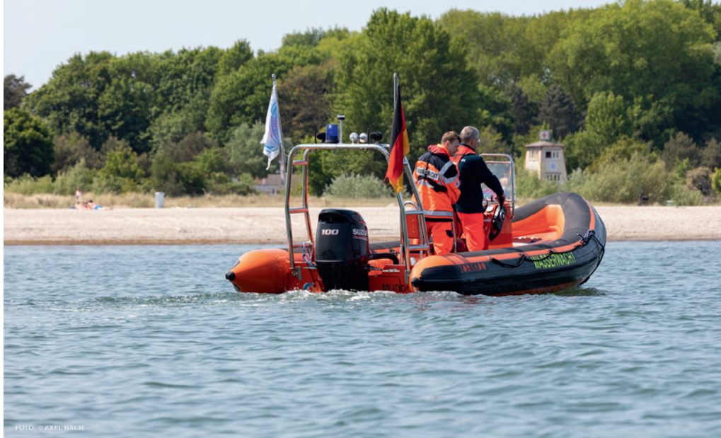
Die DRK-Wasserwacht ist von Mitte Mai bis Mitte September mit bis zu 14 ehrenamtlichen Helferinnen und Helfern, mehreren Booten und Landfahrzeugen auf dem Priwall im Einsatz.

Bis zu 14 ehrenamtliche Helferinnen und Helfer sind von Mitte Mai bis Mitte September gleichzeitig im Wachdienst auf dem Priwall. Besonders in der Ferienzeit und während der Travemünder Woche, wenn das Ostseebad zum Touristenmagnet wird, erhalten die Lübecker Wasserwachtler Unterstützung aus